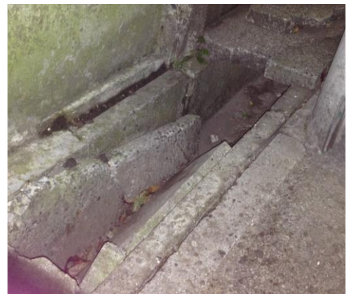
生活道路の上ぶたが割れている箇所