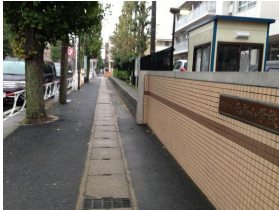
北部小正門前 歩道の真ん中に大きなU字溝

北部小の通学路の歩道で、U字溝の隙間につまづいて転び骨折した高齢者のご家族から、改善の要望が日本共産党に届き、北栄1丁目から4丁目の車が通れない生活道路を含む全歩道を点検