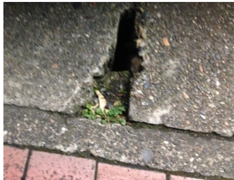
隙間部分が破損している例 割れ目部分には草が生えている

東日本大震災後、元町地域の側溝も液状化の影響で破損した箇所が多数あります。北栄3丁目に建設中のタイマーが北部小学校の正門前をお客様ルートとして指定しています。12月議会では、通学路の歩道の整備を求めました。