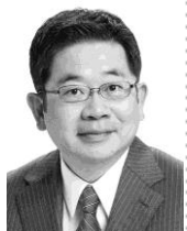
こいけ あきら 小池 晃

1960年東京世田谷区生まれ、52歳 東北大学医学部卒 日本共産党 副委員長 党政策委員長 前参議院議員 医師